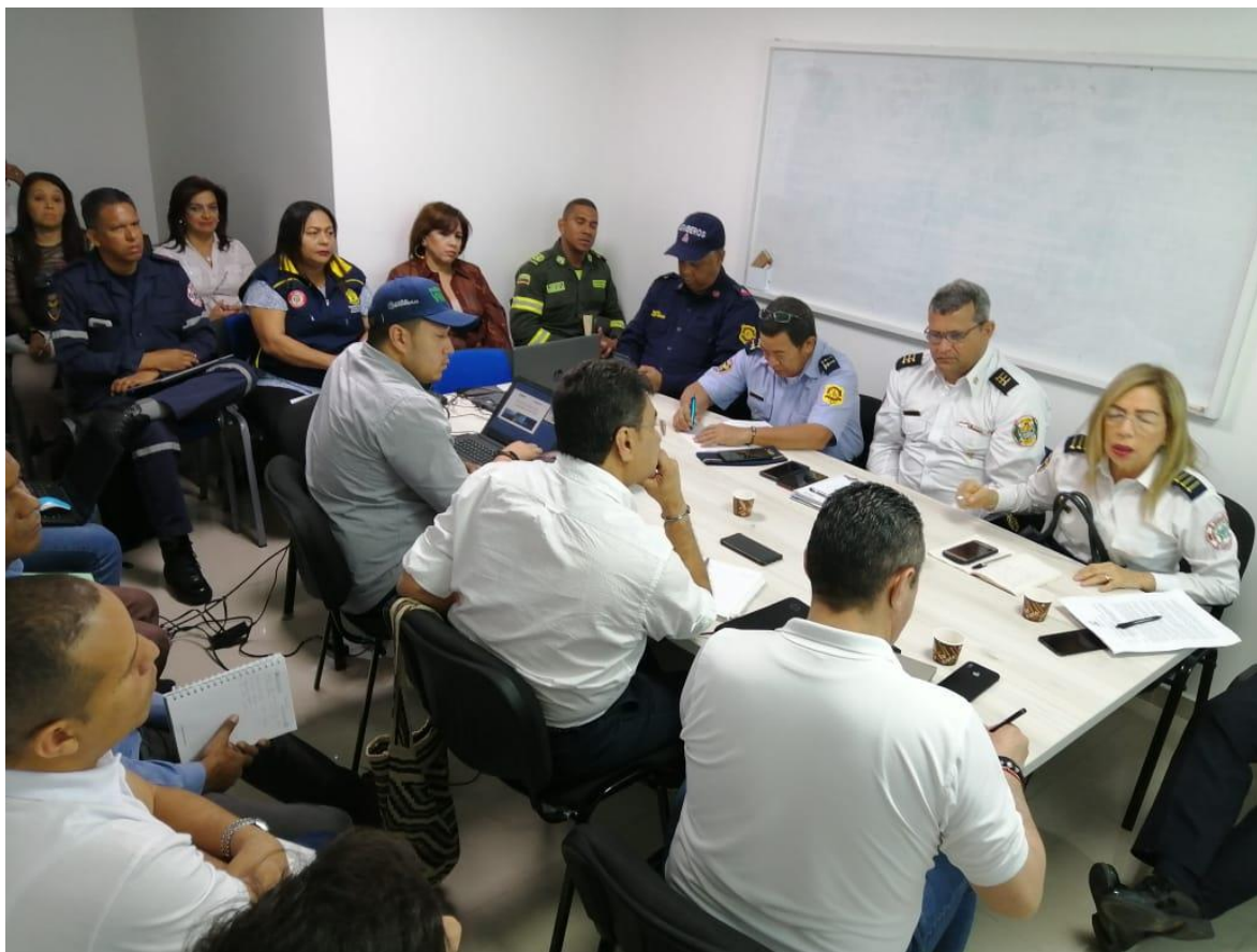
Marzo 12 de 2020. Reunión con miembros del Comité Local de Gestión del Riesgo.